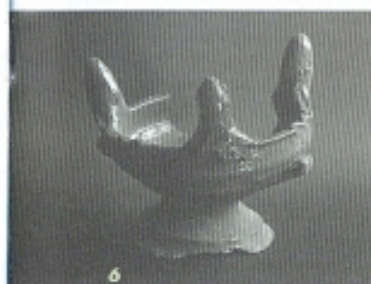
6 Escalfeta. Peça de terrissa localitzada al Raval de Dins. Segle xviii.

Els Escaiola. A Caldes de Montbui apareix documentada en el segle xvii una família Escaiola, tots els progenitors de la qual tenen l'ofici d'ollers. A principis del segle xviii, en Josep Escaiola Pujol, terrisser, emigrà a Sabadell i al cap de poc temps, el 1719, es casà amb Marianna Bolsós, pubilla d'una coneguda família de Sabadell. Amb aquest matrimoni s'encetava una llarga tradició de terrissers que