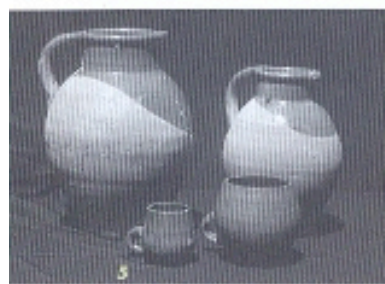
5 Mesures de vi del segle xvii, marcades amb el senyal d'una ceba i que s'ha pogut identificar com a senyal de contrast dels Escaiola.

fora; a cal Pere Muixí, al carrer de la Salut; a cal Bulsós, a la Via Massagué; a cal Magí, al carrer de les Rodes; a cal Ballbona, al carrer del Jardí, i alguna altra que no recordo, després de casa meua que era al final del carrer de la Creueta i, abans, al carrer de Sant Josep.