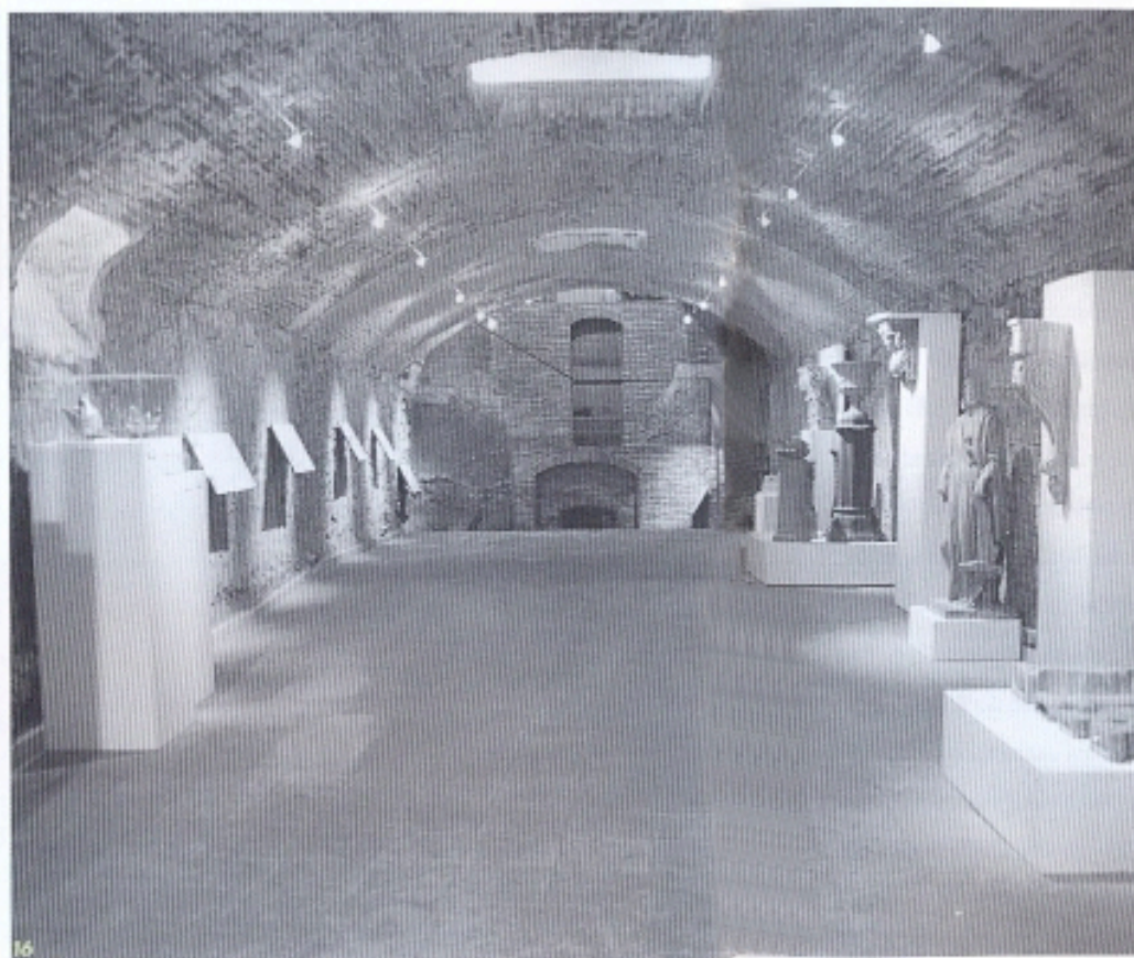
16 Detall de l'obrador de l'Escaiola, amb el forn de llevat al fons i l'exposició inaugural de l'obertura pública.

seva tipologia constructiva, és del tipus de cambres múltiples o forns de torre, amb quatre plantes verticals, la fogaina al nivell inferior i tres cambres de cocció sobreposades. Aquest sistema constructiu, de gran productivitat a cada fornada, era desconegut fins ara per aquestes contrades.