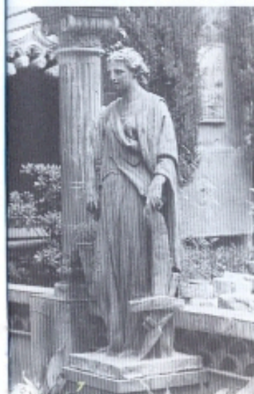
7 Detall d'una de les estàtues (l'Agricultura) del Temple de les Aigües.

ben aviat veurem instal·lats al Raval, a la cantonada amb la plaça de l'Àngel. En aquesta propietat, s'hi van mantenir al llarg del temps tant la casa pairal com la primera instal·lació d'un obrador i els forns de terrissa.