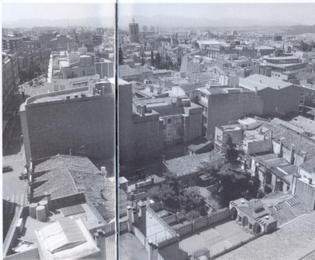
3 Al centre de la fotografia es poden veure els casals de l'Escaiola de la via de Massagué. En els números 5 i 7 és on hi havia l'obraedor i els forns de terrissa, coneguts popularment com a Cal Bolsós.

"Del meu record hi havia a cal Feliuet oller, que era a la cantonada del carrer de St. Joan amb el de St. Josep, als afores. A cal Pau oller, al Raval de dins i de