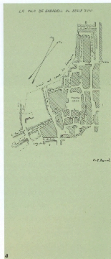
4 Àmbit de la vila de Sabadell en el segle XVII. Dibuix de M. Pascual Tintorer (1807). Els forns de l'Escaiola de l'actual Via de Massagué pertanyien aleshores a Sant Pere de Terrassa.